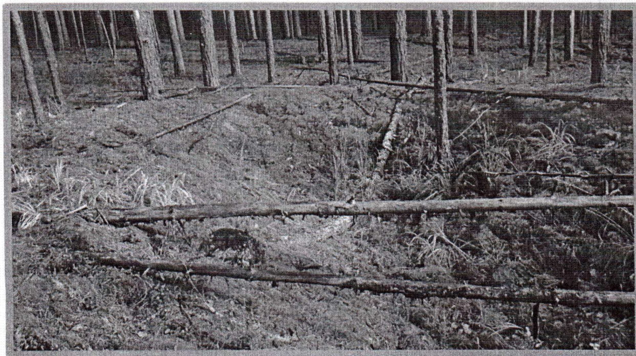
Изображение № 1 Валежник

Примеры валежника (смотри изображения №№ 1,2,3).